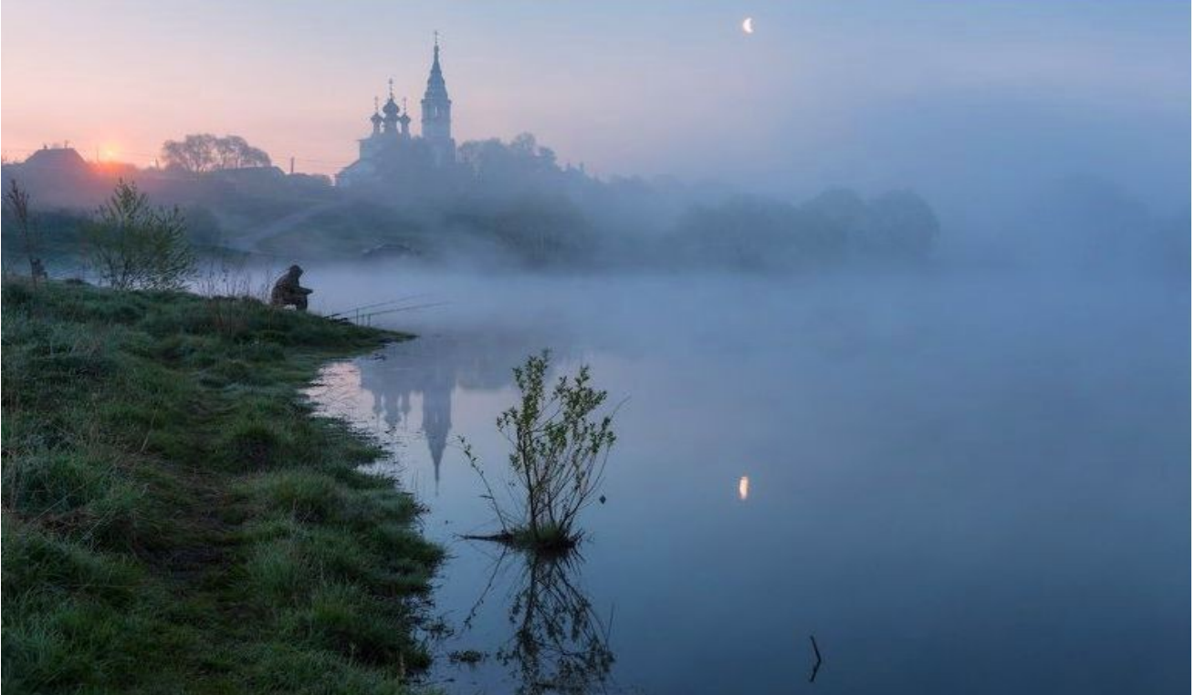
Фотограф Александр Марецкий (Россия)

https://vk.com/id106592369?w=wall-29902006_86444