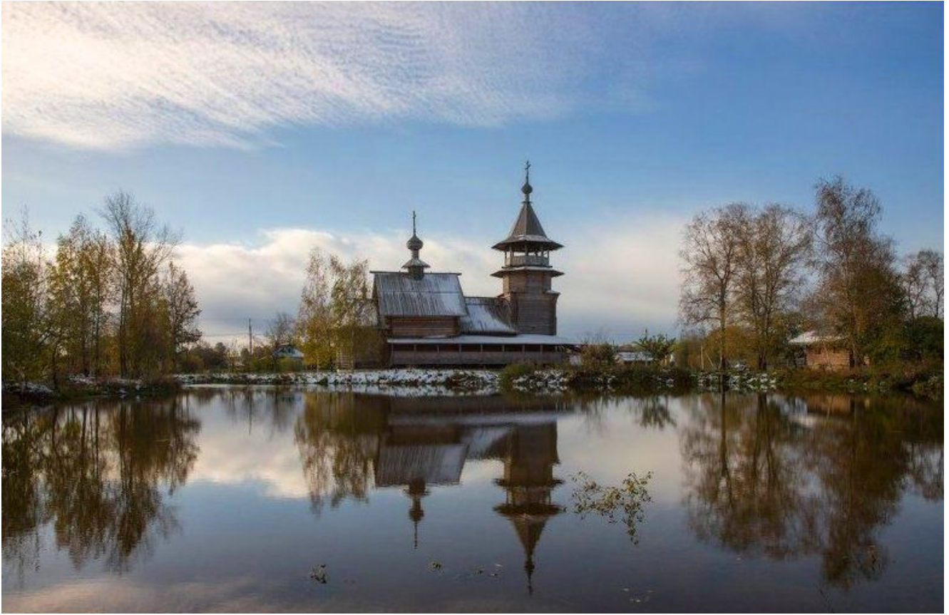
Фотограф Александр Марецкий (Россия)